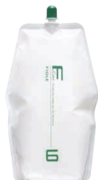
フィヨレ Fカラー BLカラー OX6 第2剤 染毛補助剤 1,000mL / 2,000mL 業務用 / 医薬部外品