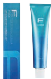
フィヨレ Fカラー クオルシア 第1剤 染毛剤 / 脱色剤 120g 業務用 / 医薬部外品