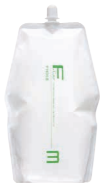
フィヨレ Fカラー BLカラー OX3 第2剤 染毛補助剤 1,000mL / 2,000mL 業務用 / 医薬部外品