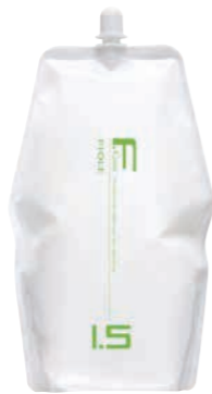
フィヨレ Fカラー BLカラー OX1.5 第2剤 染毛補助剤 2,000mL 業務用 / 医薬部外品