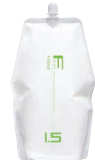
フィオーレ BLカラー OX1.5 第2剤 染毛補助剤 2,000mL 業務用 / 医薬部外品