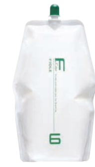
フィオーレ BLカラー OX6 第2剤 染毛補助剤 1,000mL / 2,000mL 業務用 / 医薬部外品