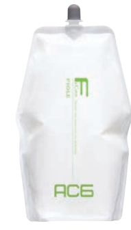
フィオーレ BLカラー AC6(アルカリキャンセル) 第2剤 染毛補助剤 2,000mL 業務用 / 医薬部外品