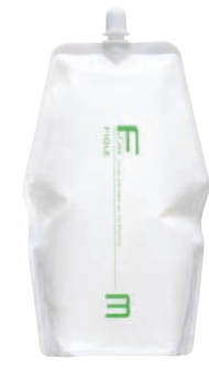
フィオーレ BLカラー OX3 第2剤 染毛補助剤 1,000mL / 2,000mL 業務用 / 医薬部外品