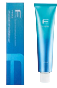
フィオーレ Fカラー クオルシア 第1剤 染毛剤 / 脱色剤 120g 業務用 / 医薬部外品